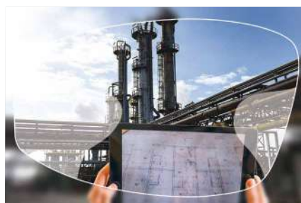
■ Ref. Monofocal Colorado ■ Ref. Progresivo Colorado

El cristal Free Form digital está disponible en unifocal y en progresivo. Se personaliza según el perfil de actividad del usuario y de los parámetros de la montura para una visión perfecta a todas las distancias y una optimización de los campos de visión . Este cristal ofrece una adaptación rápida gracias a una visión de alta resolución y a un confort óptimo. Este cristal se recomienda para las graduaciones altas y las monturas curvas.