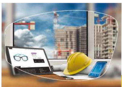
■ Ref. Ocupacional/Manhattan

Los cristales regresivos tienen como finalidad mejorar primero la visión de cerca y después la visión intermedia con una potencia decreciente en la parte alta del cristal. Existen cuatro disminuciones fijas: 0,75, 1,25, 1,75 o 2,25 dioptrías, según las necesidades. La parte inferior del cristal permite leer al usuario (a 35 cm) . La parte superior del cristal permite ver claro a una visión intermedia (a 1 m) , en una pantalla, por ejemplo. Este cristal no corrige la visión de lejos y por tanto no está adaptado para la conducción .