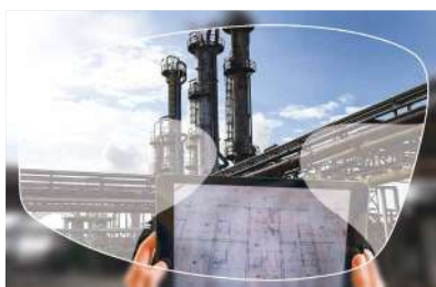
■ Ref. Progresivo Arizona

El cristal progresivo permite al presbite ver bien a cualquier distancia . La visión de lejos, intermedia y de cerca se reparten progresivamente en toda la altura del cristal, sin delimitación aparente. Este cristal se adapta a todas las actividades para una utilización diaria .