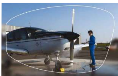
■ Ref. Monofocal Arizona

Estos cristales solo tienen una graduación para una distancia dada : para la miopía, para la hipermetropía o para el astigmatismo. Se llaman de foco simple porque permiten ver o de cerca o de lejos, pero no a todas las distancias .