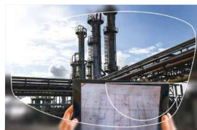
■ Ref. Bifocal D28

Destinados para las personas que necesitan utilizar la visión de cerca y la visión de lejos: la parte superior del cristal corrige la visión de lejos y la zona inferior corrige la visión de cerca.