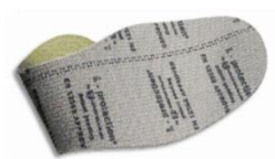
Plantilla anti-perforación flexible