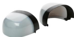
Puntera no metálica