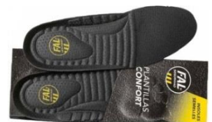
Plantillas extraíbles. Lavable