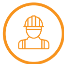
Protección de las personas

tcr es una empresa que, desde 1990, se dedica a facilitar el control y la protección del riesgo laboral en las empresas