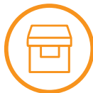
Protección de los productos

Ponemos al alcance de las empresas diferentes tipologías de producto