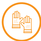
Equipos de protección individual (EPIs)